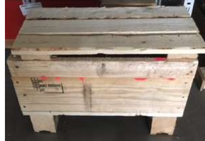
Abbildung 2: Wooden Box IPPC-Standard 1