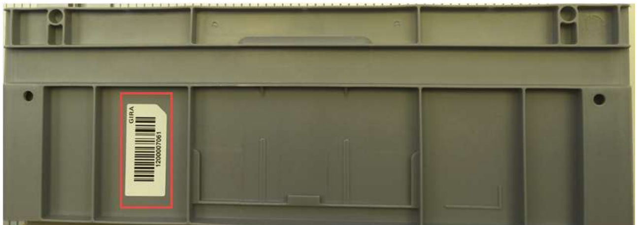
Figure 1: Gira-Barcodelabel

Wird vom Lieferanten eine Kennzeichnung auf einer Gira Mehrwegverpackung aufgebracht, so soll diese einfach und ohne Hilfsmittel rückstandslos entfernbar sein. Gira behält sich vor die Kosten zur Entfernung schlecht ablösbarer Etiketten dem jeweiligen Absender in Rechnung zu stellen. Die Gira-Barcodes auf den Mehrwegbehältern dürfen weder entfernt noch überklebt noch in sonstiger Art und Weise verändert werden (siehe Fig.1 ).